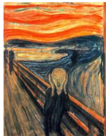
Le cri, Edvard Munch