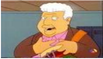
Tito Puente dans « The Simpsons »