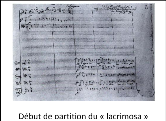
Début de partition du « lacrimosa »