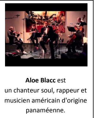
Aloe Blacc est un chanteur soul, rappeur et musicien américain d'origine panaméenne.